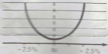
Diagrama radiación vertical